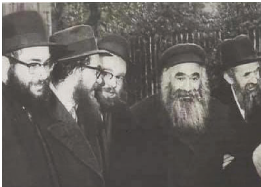
"פדה בשלום נפשי" תמונה מיום יצאתו מרוסיה וביאתו לאנגליה

תמיד היה בשמחה ותבע מהתמימים להיות בשמחה, 'חס ושלום, עצבות און מרה שחורה!' – היה צועק בהתוועדויות. גם לגבי כל הבעיות של הבחורים שהיו מספרים לו, היה אומר שרק על ידי שמחה אפשר לפתור את כל הבעיות'.