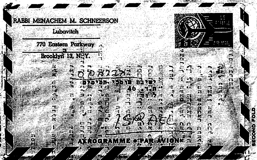
"לעשות כהוראת הרב דכפר תב"ד" מענה לשאלה האם לנהוג יו"ט שני של גלויות