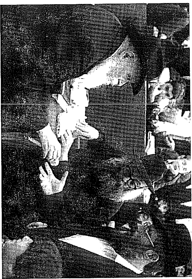
אבנו מקבל "לעקארה" מלידו חק' של הרבי

אין ספק שסיפורים אלו המלאים בלחלוחות רוגש חסידי, יעוררו את הקוראים להליכה באור תורת החסידות, דרכיה ומהגותיה.