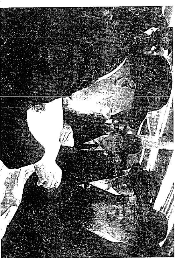
זקנו מקבל כוס של ברכה מלידו חק' של הרבי