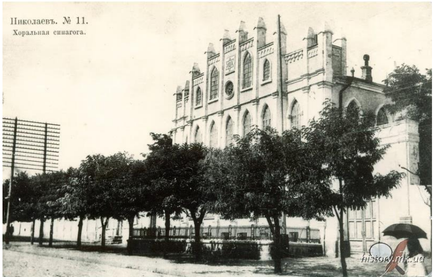
Николаевъ. № 11. Хоральная синагога.

בית הכנסת הישן (למעלה) והחדש (למטה) בניקולייב