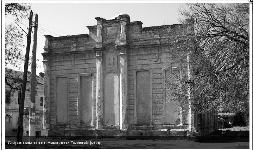
Старая синагога в г. Николаеве. Главный фасад

בית הכנסת הישן (למעלה) והחדש (למטה) בניקולייב