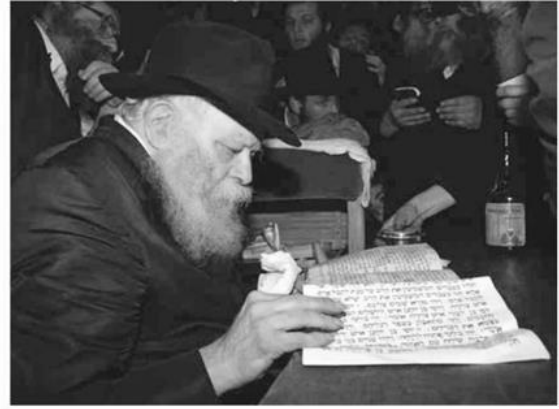
אמירת ברכה אחרונה ו"ויתן לך"

ואחזה בידו הימנית הק', נטל את הסידור בידו השמאלית הק', החל לנגן "כי בשמחה תצאו", ויצא מביהכ"נ (בלי לגעת בפרוכת) בשעה 12:14 כשמעודד את השירה מעט בידו השמאלית הק' (בה החזיק את הסידור כנ"ל).