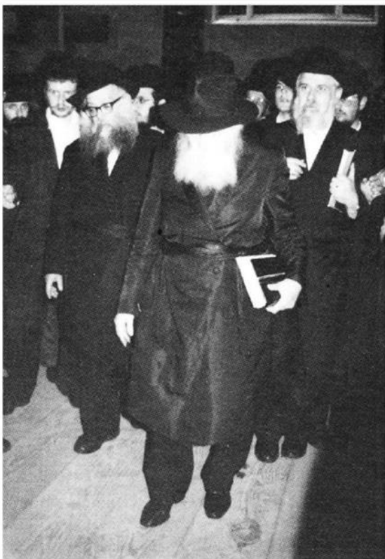
בצאתו לקידוש לבנה