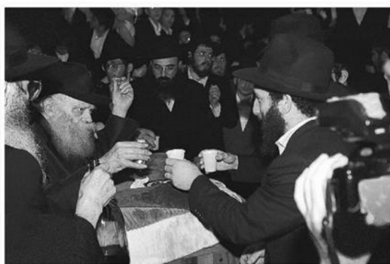
חלוקת "כוס של ברכה"

תנועות בידו השמאלית הק', ומאז עודד את השירה בחוזק ולכל עבר כמעט בכל ניגון, ובמיוחד כשעברו ילדים שאז עודד לעברם את השירה בחוזק.