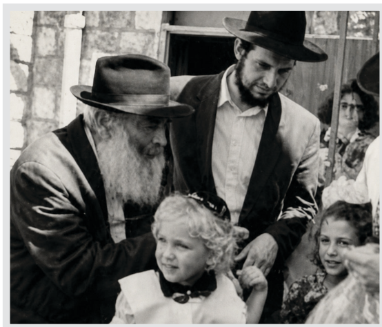
בתספורת של נינו בציון הרשב"י במירון

ובטשקנט, היה הבית פתוח לאורחים ומלא חיים.