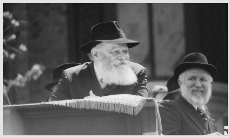
מביט בתהלוכה - ל"ג בעומר תש"מ

בזה אחר זה החלו להגיע אוטובוסים רבים מכל חלקי העיר ופלטו מתוכם אלפי ילדים יהודים והוריהם שהגיעו במיוחד לפאראד. מעריכים שקרוב לעשרים אלף ילדים והוריהם הצטופפו מול בנין 770 ו-778 שקושתו בשלטי ענק ססגוניים בעברית ובאנגלית עם כתובות כגון "ואנחנו עמך גו'", "והשיב