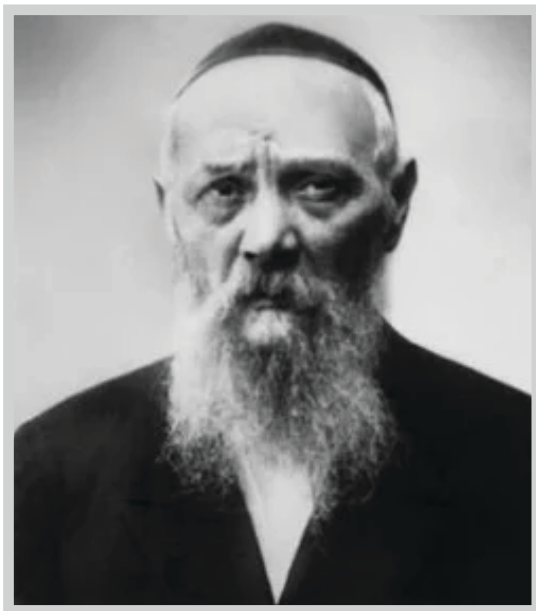
ר לוי'ק - אביו של הרבי מלך המשיח

כשהגיעו ליעדם לאחר שעות של הליכה לאורך פסי הרכבת (אנשים רבים היו רגילים ללכת לאורך מסילות הרכבת מאחר שהיה נוח להגיע כך מאזור לאזור בעיר) גילו השניים לתדהמתם כי השופר אבד בדרך.