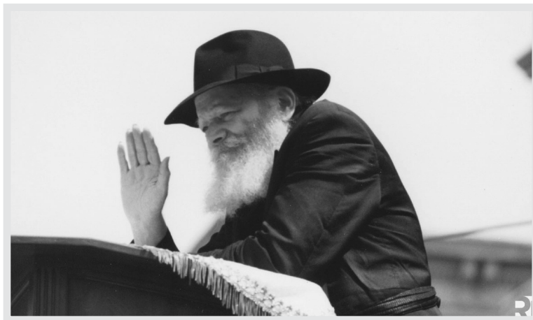
הרבי מנופף לשלום בתהלוכה - ל"ג בעומר תש"מ

לב אבות גו", "ל"ג בעומר – שנת השלושים לכ"ק אדמו"ר שליט"א", כל י"ב הפסוקים ועוד.